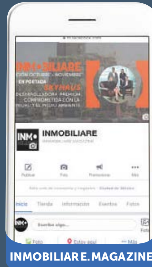
INMOBILIARE E. MAGAZINE